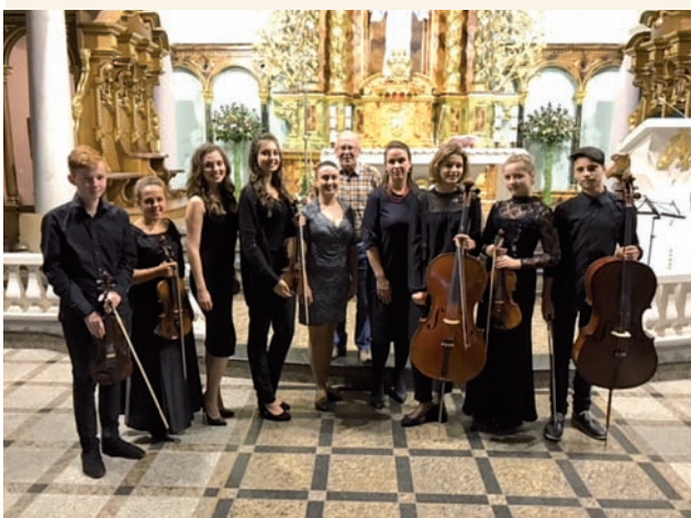
Koncert w kościele